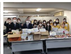
【明治安田生命保険㈱】