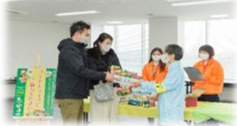
【地域でのフードドライブイベント】