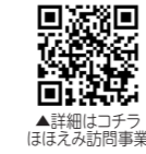
▲詳細はコチラ ほほえみ訪問事業