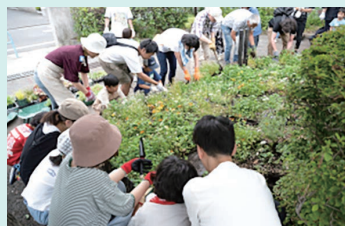
東矢口三丁目公園での花壇作業の様子

花壇活動は、新蒲田二丁目児童公園と東矢口三丁目公園の花壇を、入会手続きなく、あらゆる「みんな」が自由な形で使える状態を目指しています。月に1度の集合活動のほか、自分のペースで花壇作業やパトロールをしたり、自宅で公園のための花を育てたり、また、オンラインチャットで話し合ったりしています。公園もインターネットも、だれでもいつでも使えるツール