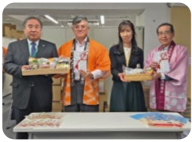
▲全国調理食品工業協同組合 様(煮豆・佃煮)