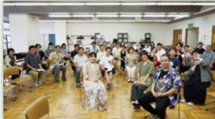
おおた社会福祉士会と共催 社会を明るくする運動の一環参加者のみなさんと

月に一度の定例会と、社会福祉協議会の助成金を活用した拡大定例会を年に3～4回開催し続けています。当初からおおた社会福祉士会には大いに協力してもらっています。