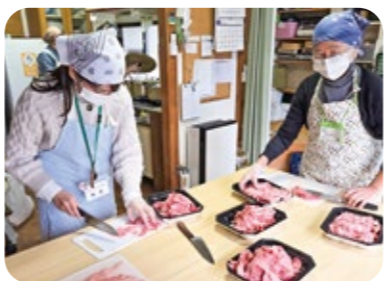
▲東京食肉市場株式会社 様(国産牛肉を調理)