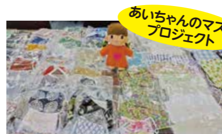
あいちゃんのマスクプロジェクト

コロナ禍に負けないかつ、温もりを感じる手作りマスクを現在も区民の皆さんから募集しています！ お預かりしたマスクは、一人親家庭や福祉施設を中心にお届けする予定です。