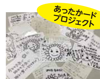
あったカードプロジェクト

日々の生活や施設内の清掃等で、重宝される「雑巾」を募集しています。 皆さんよりお預かりした「雑巾」は、おおた社協を通じて、区内福祉施設等へお届けします。