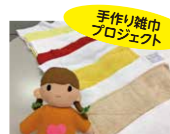
手作り雑巾プロジェクト

コロナ禍に負けないかつ、温もりを感じる手作りマスクを現在も区民の皆さんから募集しています！ お預かりしたマスクは、一人親家庭や福祉施設を中心にお届けする予定です。