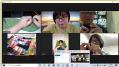
ある日の「編み部」の様子

でおしゃべりを楽しみながら交流していること。【英語でおしゃべり部】、【ぶちヨガ部】、【編み部】、【動物大好き部】、【ゆるっと子育て部】などがあり、5月か