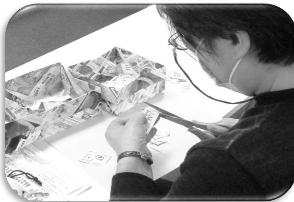
使用済み切手を活用して、食料支援活動の資金作りのための活動を進めています。