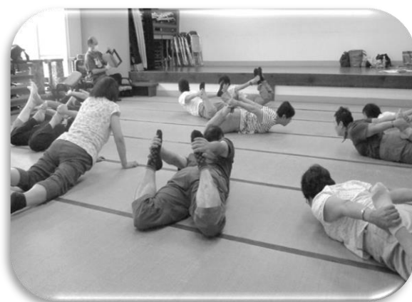
健康体操や子育てなど関心のあるテーマで活動する「サロン活動」を支援しています。