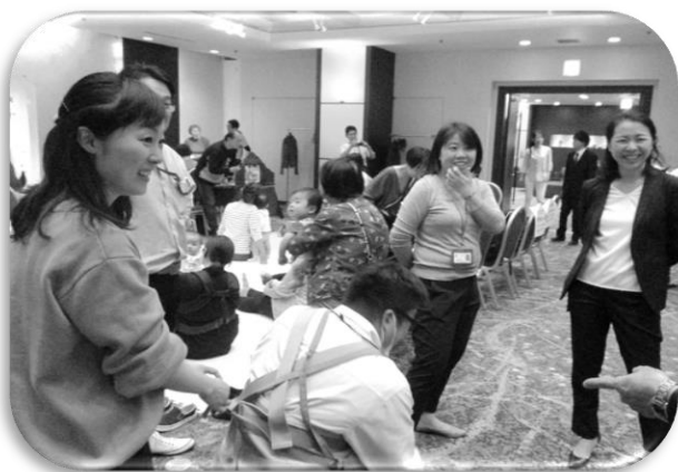
ボランティアやNPO団体が協力して開催する研修会等を支援し、活動の充実を図っています。