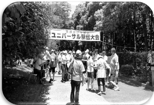
年齢や性別、障害の有無を超えて、共にスポーツで汗を流しています。