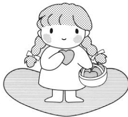
大田社協イメージキャラクターあいちゃん