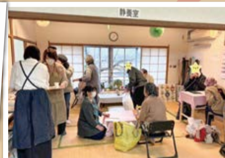
コーヒーの香りたたく和やかなひととき

調布地域にある社会福祉法人が協力をして、生活にお困りの方に食料品を提供する取組(フードパントリー)を、令和6年1月と2月に開催しました。併設したカフェ・相談コーナーに来場した方は、スタッフに気軽に困りごとなどを相談していました。