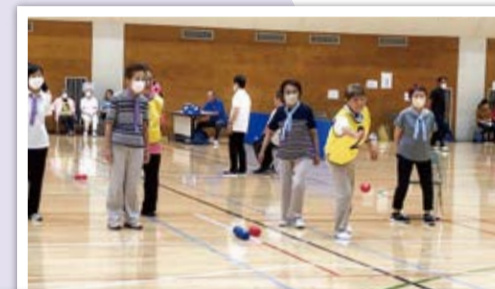
居場所出会った仲間たち

高齢の方が外出するきっかけとしてはじまった「池上ボッチャの会」は、ボッチャを教える人や、試合に出る人、応援する人など、居場所を通じてたくさんのつながりが生まれています。定期的にみんなで集まり、楽しく練習を行っています。