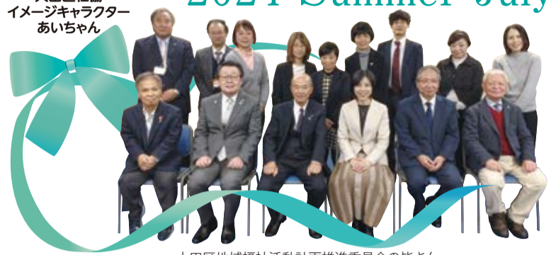
大田区地域福祉活動計画推進委員会の皆さん 2024/3/8

編集・発行 社会福祉法人 大田区社会福祉協議会 〒144-0051 東京都大田区西蒲田7-49-2 ☎ 03-3736-2021 FAX 03-3736-2030 🌐 https://www.ota-shakyo.jp 🐦 https://twitter.com/ota_shakyo