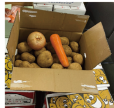
▲丹精込めて育てられた大きな野菜