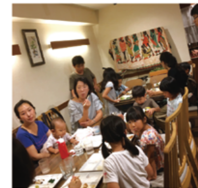
▲野菜やフードドライブの食品が美味しい料理に(子ども食堂だんだん)