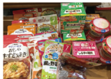
▲皆様のあたたかい想いで集まった食品は735点202.6kgとなりました