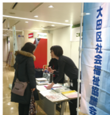
▲2日間で100名の方に食品を寄付いただきました

ボランティアセンターは、企業や商店等の社会貢献活動をサポートしています。地域とともに、地域に向き合う企業・商店の活動を紹介します。