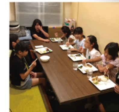
▲みんなで食べるとおいしいね