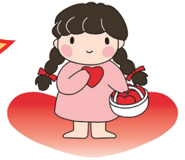
大田社協イメージキャラクター あいちゃん

昨年度は「歳末たすけあい・地域ふれあい募金」として、 36,923,961円 をお寄せいただきました。 みなさまのお力添えにあらためて御礼申し上げます。