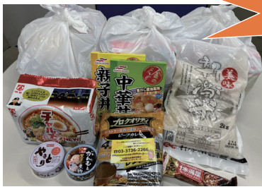
フードパントリー事業 一時的に生活を維持するための収入を得ることが、困難な状況になった方に対して、無料で食料を提供します。