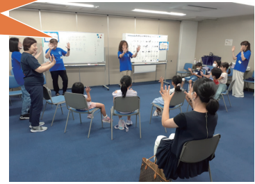
地域福祉活動団体支援事業 地域共生社会の実現に向けた活動を行っている団体を、安定的かつ継続的に支援します。