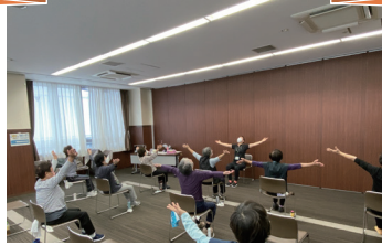
「つどいの場」運営支援事業 地域の方が、身近な場所で、交流できる場づくりの支援を行います。