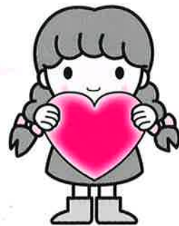
イメージキャラクター あいちゃん