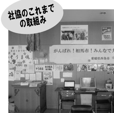
社協のこれまでの取り組み