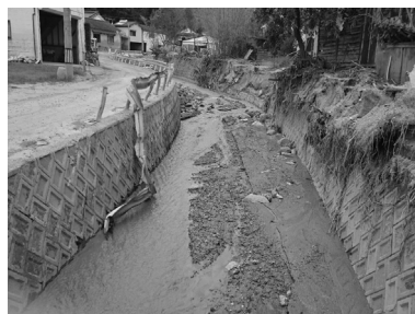
九州北部豪雨 (福岡県朝倉市)