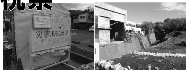
伊豆大島土砂災害(東京都大島町)