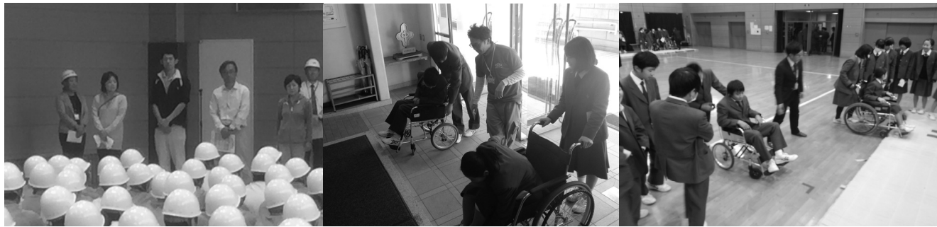
左(石川台中学校) 中、右(大森第十中学校) 地域包括支援センター上池台、山王リハビリクリニック、大田区福祉用具事業者連絡会(株)カラーズ、フランスベッド(株)メディカル、ヤマシタコーポレーション、(株)東基の方が講師として協力