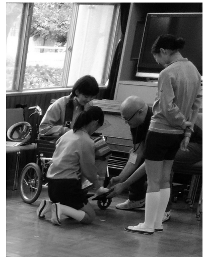
ナイスケア大田介護センター、ファミタウン洗足の方が講師として協力

実際の災害時において中学生は主役です。日ごろから地域での要配慮者に関心を向け、地域での支えあい、つながりを感じ、協働して支え合うまちづくりに向けた授業を今後も応援していきます。