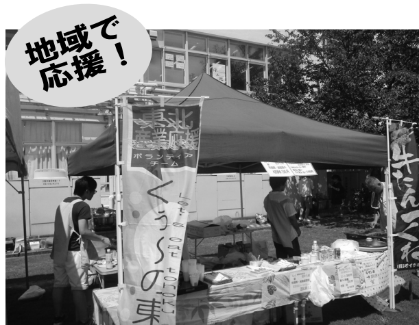
被災地物品の販売「くう～の東北」

今後も多くの方が協働し、多様な災害時のニーズへの対応を継続し検討していくとともに、平常時における被災地への支援、地域力の向上とつながりを育み、いざという時の対応力を高めていきます。