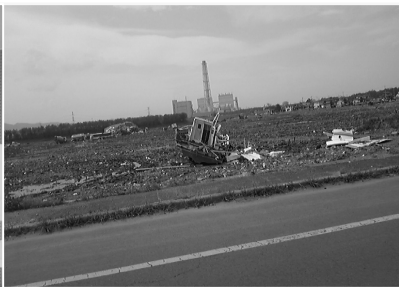
東日本大震災 (福島県相馬市)