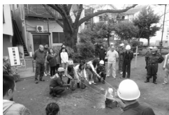
町会主催の外国人対応防災訓練 「英会話同好会 from OTA(EDO会)」