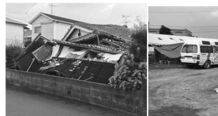
熊本地震（熊本県益城町）