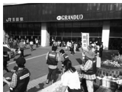
熊本地震 都内一斉駅頭募金