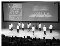
東松島復興支援 絆音楽祭