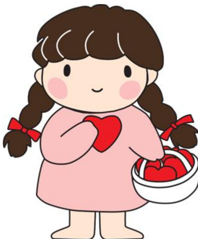
大田区社会福祉協議会イメージキャラクター あいちゃん